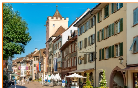
Städtli Rheinfelden mit Rathausturm

Das aargauische Rheinfelden ist eine kleine Stadt mit grossem Charakter. Zwischen Altstadt, Rhein und Geschichte verbergen sich zahlreiche besondere Sehenswürdigkeiten und Eigenheiten. Mit dem Stadtmotto 2026 «Rhyfælde - wo d' Sunne dehäi isch!» lädt das älteste Zähringerstädtchen der Schweiz auf charmante Art zum Entdecken, Verweilen und Entspannen ein.