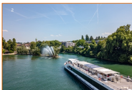
Rhytärn auf dem Amazonas der Schweiz